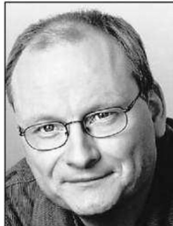
Unterstützt „Kinder können Klima“: der bekannte Meteorologe Sven Plöger.

„Kinder können Klima“ ist ein Projekt, um in vielen Schulen mit Kindern von etwa sechs bis zehn Jahren einen Zugang zu Natur, Klima, Wetter und der Wahrnehmung der Elemente überhaupt zu finden. Von den Kindern zusammen gestellte Klimaausstellungen